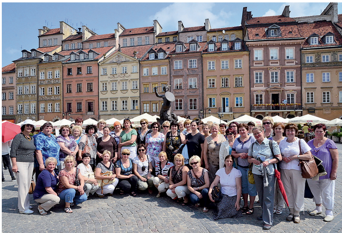
LSSO ALYTAUS SKYRIAUS SLAUGYTOJŲ IŠVYKOS, PADEDANČIOS STIPRINTI SKYRIAUS NARIŲ TARPUSAVIO BENDRAVIMĄ BEI UŽMEGZTI RYŠIUS.

Ypatingą dėmesį skiriame ryšiu su PG, jų taryba, aktyvistais palaikyti. PG atstovaujantieji supranta, kad kiek-