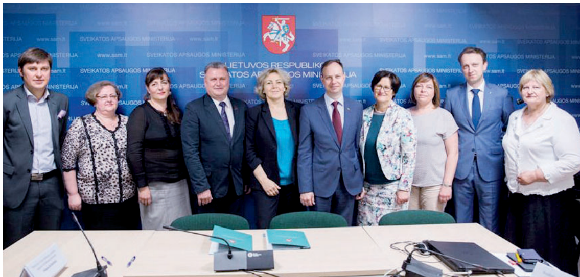
SVEIKATOS APSAUGOS MINISTERIJOS IR SVEIKATOS DARBUOTOJŲ PROFESINIŲ SĄJUNGŲ ATSTOVAI