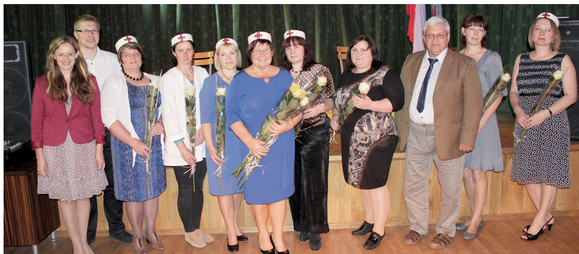
KUPIŠKIO SOCIALINĖS GLOBOS NAMŲ PIRMINĖS GRUPĖS ŠVENTINĖS AKIMIRKOS.

LSSO - organizacija, kuri mus vienija ir mūsų profesiją daro pastebimą, atkreipia dėmesį į jos svarbą. Kas kitas, jei ne mes pačios, kalbės apie ją. LSSO turi gyvuoti, kad slaugytojų profesija neliktų gydytojų šešėlyje. Slaugos pokyčiai turi vykti ta kryptimi, kuri skirta žmogui, santykiui