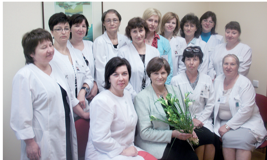
2011 M. PSICHIKOS SVEIKATOS SLAUGYTOJOS.

kaciją, bendradarbiauti su kitomis LSSO draugijomis, teikti kvalifikuotas ir kokybiškas slaugos paslaugas. Psichikos sveikatos slaugytojų draugija organizuoja mokslines-praktines konferencijas aktualiomis temomis: „Darbo su priklausomais nuo alkoholio asmenimis ypatumai“ (2008 m.), „Pagyvenusių žmonių sveikatos problemos ir jų sprendimo galimybės“ (2009 m.), „Mums rūpi žmogaus gyvybė“ (2009 m.), „Psichikos sveikata – sveikos šeimos pagrindas“ (2011 m.), „Į gerovę per miegą“ (2012 m.)